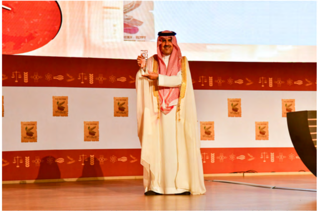
El Dr. Hussam Alangari, presidente del Tribunal General de Cuentas del Reino de Arabia Saudí, galardonado con el Premio INTOSAI al Futuro.