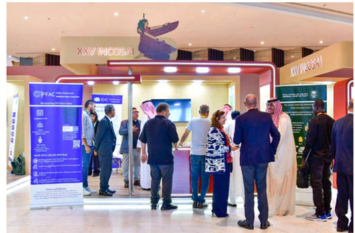
Comité de Política, Finanzas y Administración de la INTOSAI.