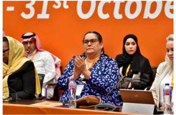
Itzel Anai Palacios, Magistrada Presidenta del Tribunal Superior de Cuentas (TSC) de Honduras.