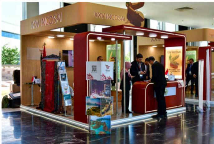
Consejo de Auditoría de Indonesia, vicepresidente de la INTOSAI.