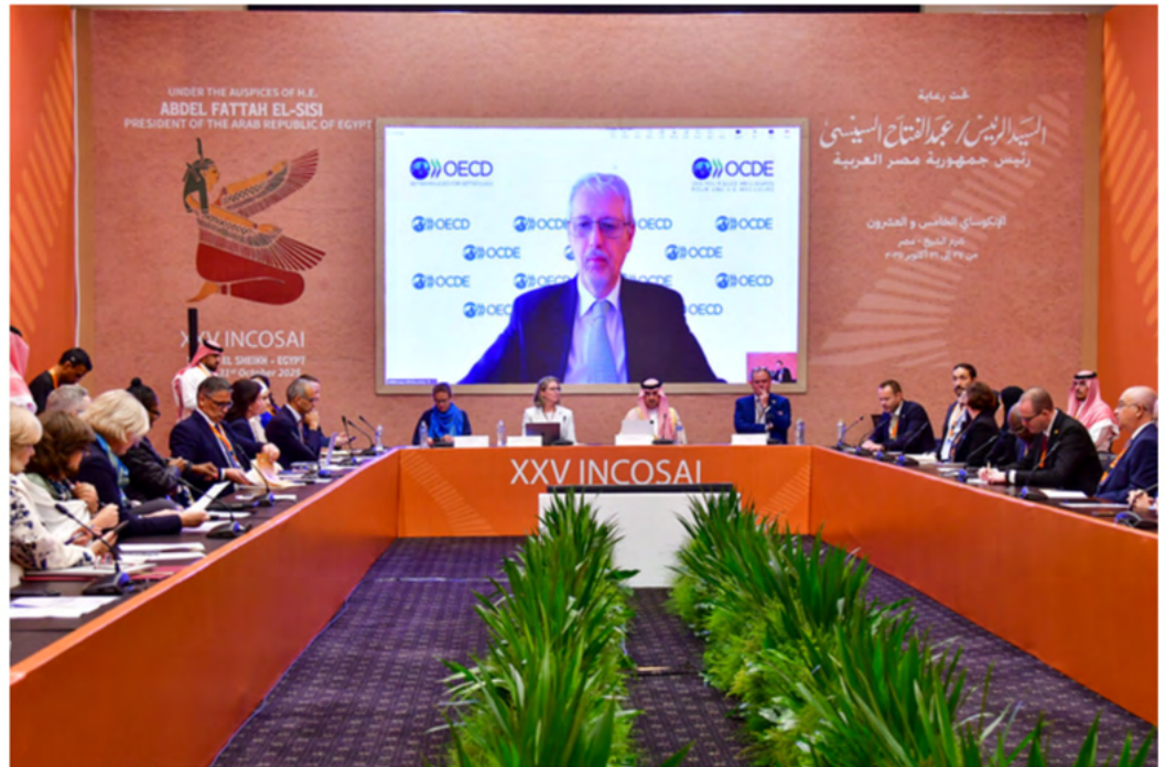
Evento paralelo del Proyecto Global IDI-OCDE sobre la independencia de las entidades fiscalizadoras superiores. Fuente: Revista Internacional de Auditoría Gubernamental