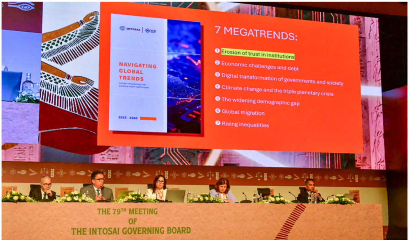
Presentación de la SCEI del Informe “Navegando por las Tendencias Mundiales”.