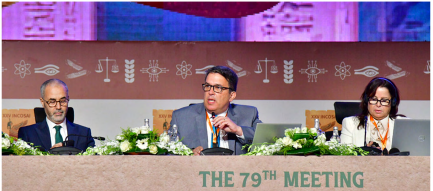
Presentación de la SCEI del Informe “Navegando por las Tendencias Mundiales”.