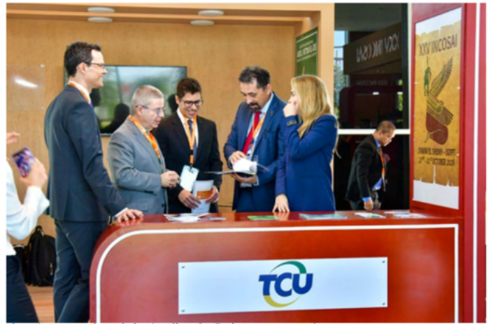
Tribunal Federal de Cuentas de Brasil.