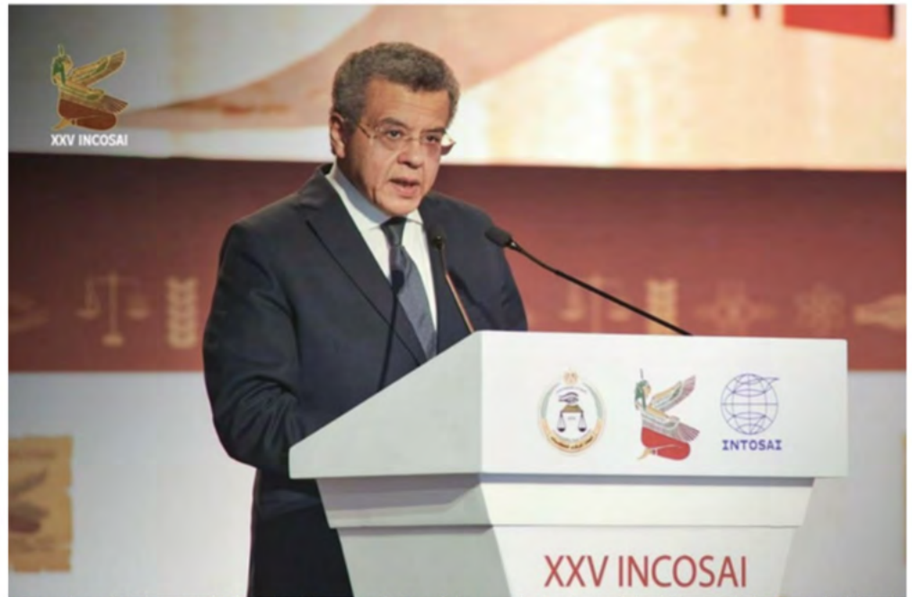
Consejero Mohamed El-Faisal Youssef, Presidente de la Autoridad Estatal de Rendición de Cuentas de Egipto y Presidente de la INTOSAI.