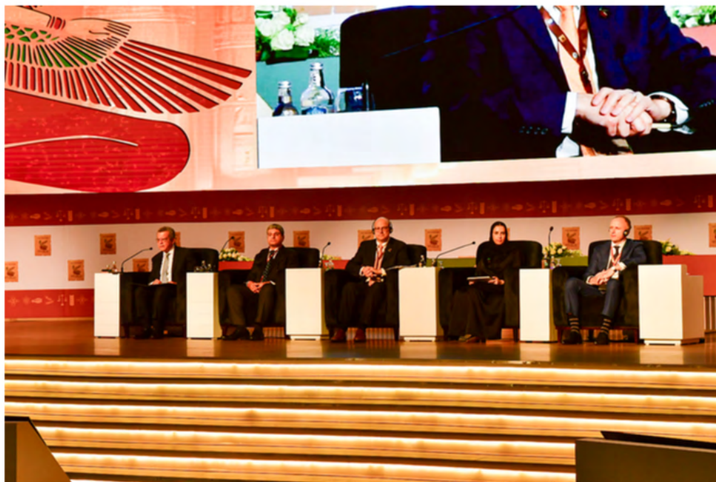
Ponentes del Tema 1.