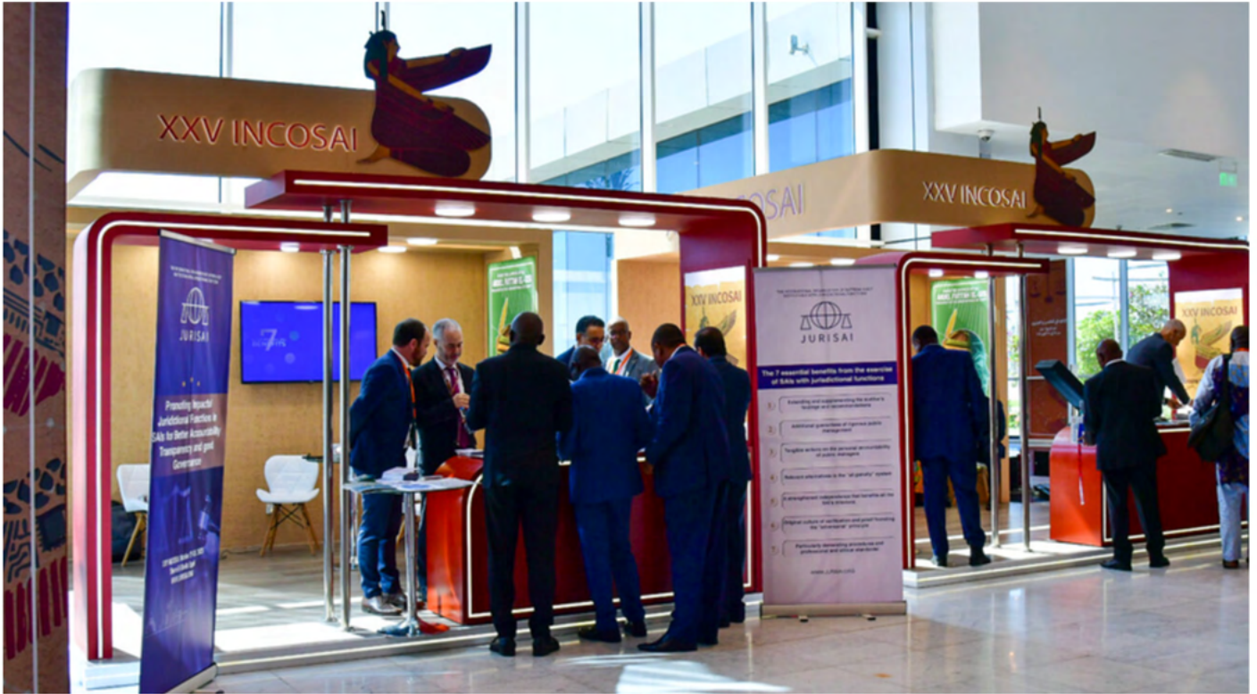
El stand de JURISAI en INCOSAI XXV.