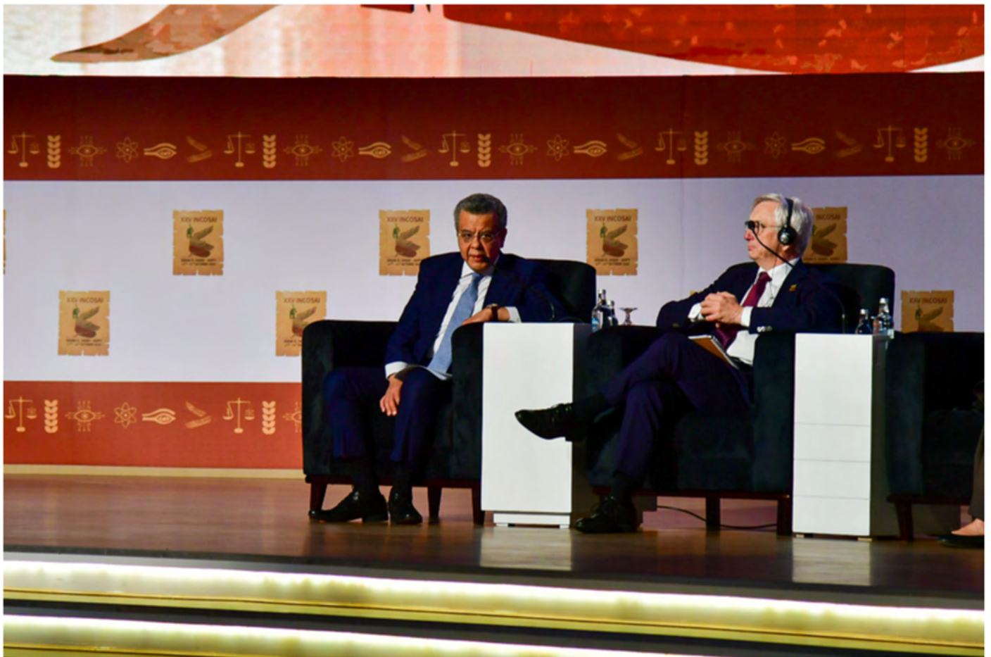
El presidente de la INTOSAI, Mohamed El-Faisal Youssef, de la Autoridad Estatal de Rendición de Cuentas (ASA) de Egipto.

Ahora bien, este optimismo no pecaba, en absoluto, de ingenuidad. Así, los encuestados expresaron su manifiesta preocupación por la calidad de los datos, la transparencia de los algoritmos, los marcos de gobernanza y la alfabetización digital. La integración de la IA, coincidieron, requiere algo más que la adquisición de software — demanda una transformación digital, competencia en algoritmos y la adopción de un modelo híbrido donde la capacidad de las máquinas sirva de complemento a la pericia humana. En su inmensa mayoría, los delegados del INCOSAI también estuvieron de acuerdo con que la IA no debe ser un sustituto de los auditores, sino un socio y aliado.