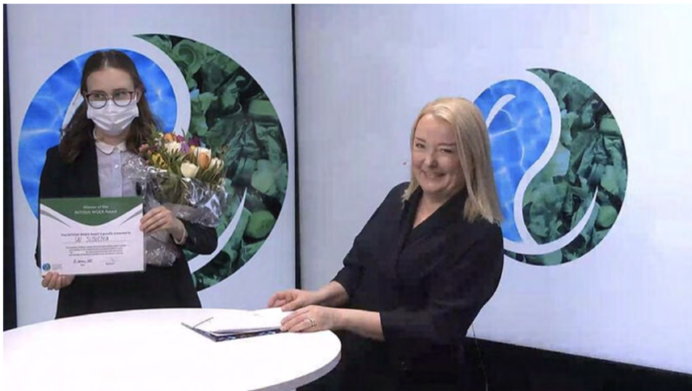
Entrega del primer Premio del GTAMA de la INTOSAI en la 20ª Asamblea del GTAMA de la INTOSAI, retransmitida en línea desde un estudio en Helsinki.

Una innovación para celebrar el éxito fue el lanzamiento del Premio del GTAMA “Inspiración en Auditoría Medioambiental”. El objetivo del Premio es reconocer los logros y animar a los auditores a explorar nuevos enfoques y buenas prácticas. Ya se ha concedido cuatro veces en la Asamblea del GTAMA.