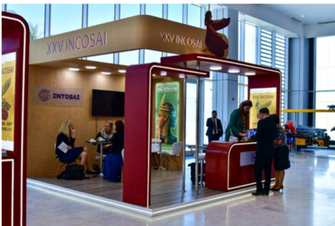
Secretaría General de la INTOSAI. Fuente: Revista Internacional de Auditoría Gubernamental