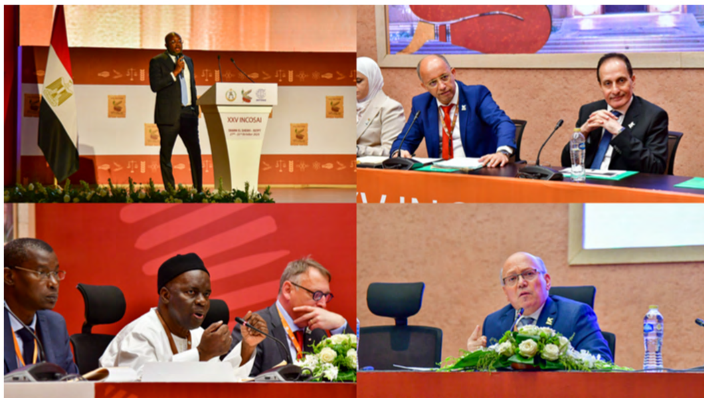
Moderadores del Tema 1.

De todos los debates en grupo mantenidos en los diferentes idiomas sobre el Tema I, emergió un mismo mensaje: las capacidades institucionales apuntalan la credibilidad. El Tribunal General de Cuentas de Arabia Saudita ofició de relator general y sintetizó los debates moderados por la Comisión General de Auditoría de Liberia (EFS de Liberia) y la Contraloría del Estado de Israel (EFS de Israel) [inglés]; la Oficina de Auditoría de Jordania (EFS de Jordania) y el Tribunal de Cuentas de Túnez (EFS de Túnez) [árabe]; la Oficina del Auditor General de Canadá (EFS de Canadá) y el Tribunal de Cuentas de Senegal (EFS de Senegal) [francés]; y la Contraloría General de la República de Panamá (EFS de Panamá) y la Contraloría General de la República de Perú (EFS de Perú) [español].