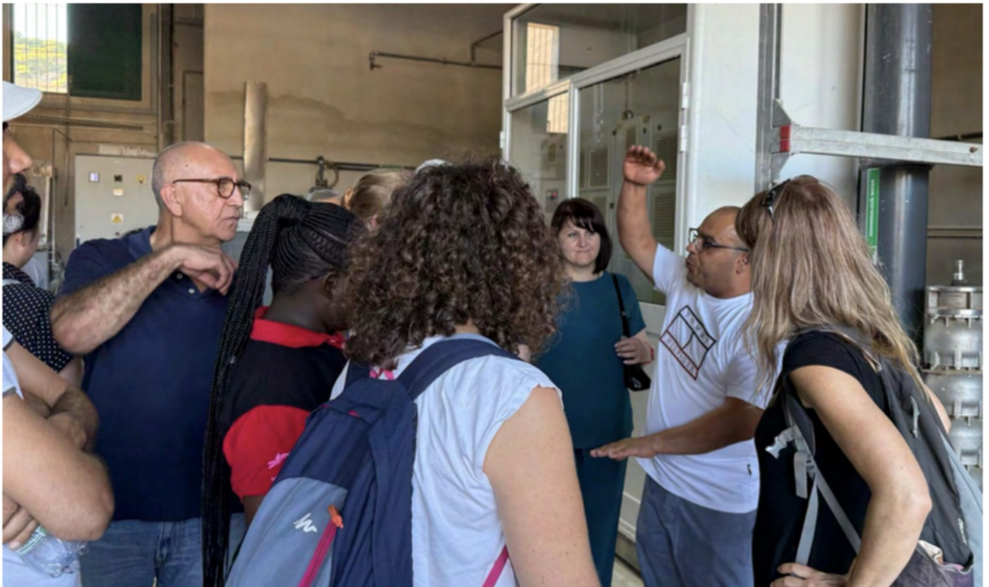
Excursión al centro de reciclaje de aguas residuales de Malta durante la 23ª Asamblea.

En la 21ª Asamblea, celebrada en Ukulhas (Maldivas), viajamos a través de mares agitados para debatir sobre la resiliencia climática; durante la 22ª Asamblea, experimentamos el gélido clima invernal ártico en Rovaniemi; y en la 23ª Asamblea, celebrada en Malta, conocimos los retos relacionados con el agua en la región mediterránea. Estas reuniones incluyeron visitas a un banco de arena, a pastores de renos y a un centro de reciclaje de agua.