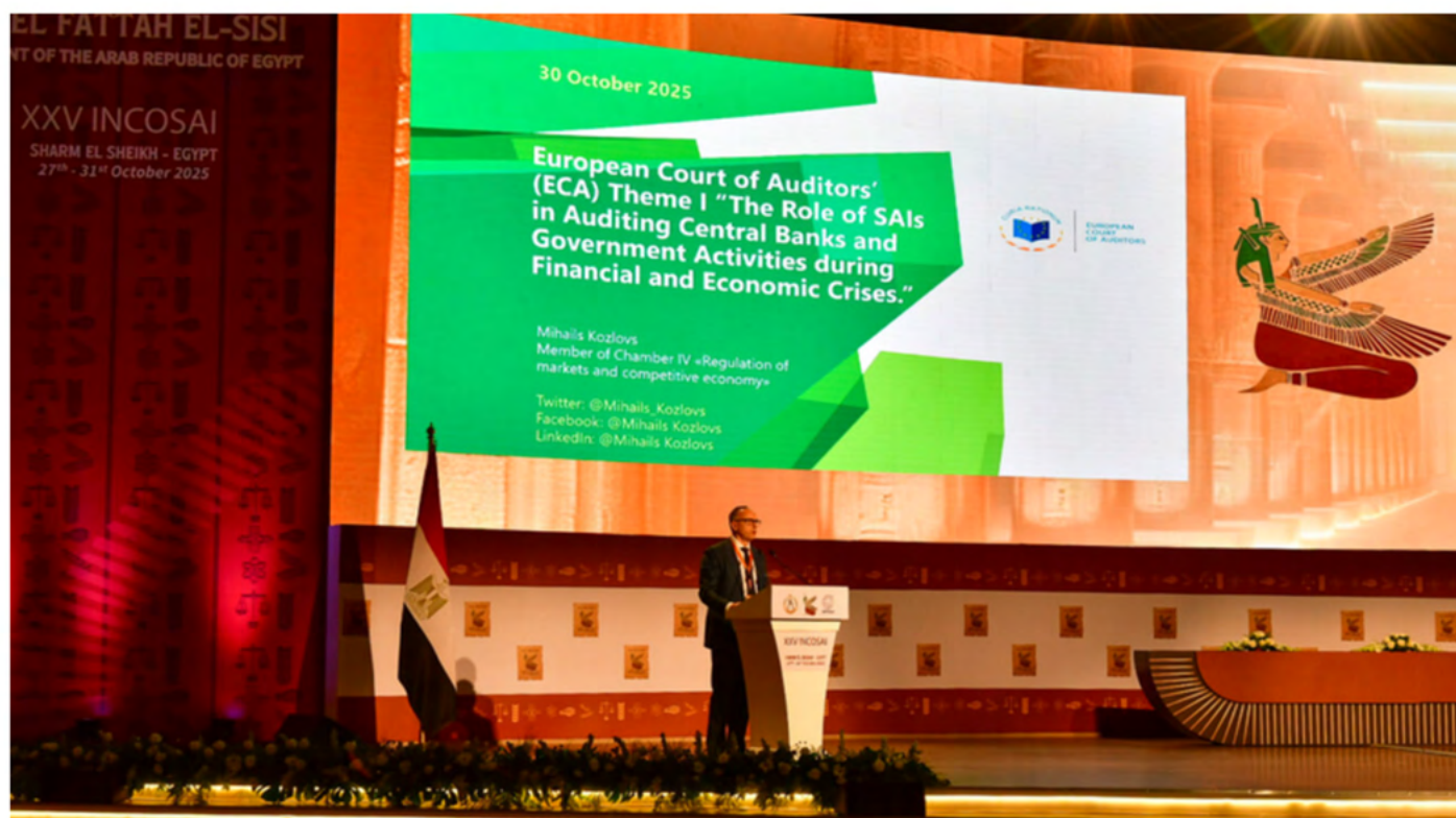
Mihails Koslovs, del Tribunal de Cuentas Europeo (ECA).

El TCE afrontó este escenario en constante evolución recurriendo a auditorías del desempeño e intentando generar un clima de confianza mutua con los auditados. Con todo, no resultó una tarea fácil, ya que, en este ámbito, cada auditoría es única, políticamente sensible y técnicamente exigente. La preocupación por la confidencialidad y las barreras al intercambio de información obligaron a implantar infraestructuras tecnológicas seguras y a actualizar los sistemas. En cualquier caso, el principio básico sigue siendo el mismo: la independencia y la rendición de cuentas no constituyen fuerzas opuestas. Debidamente estructuradas, se refuerzan mutuamente.