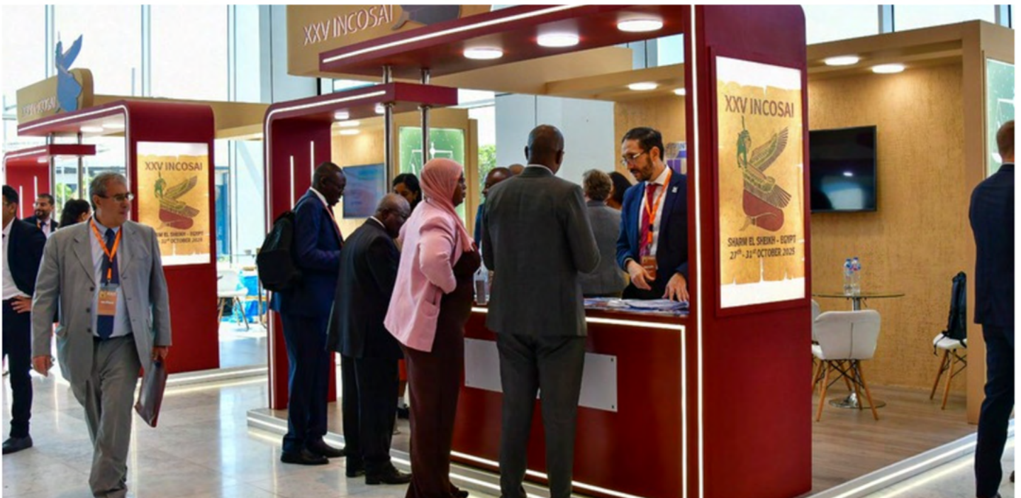
Iniciativa de Desarrollo de la INTOSAI.