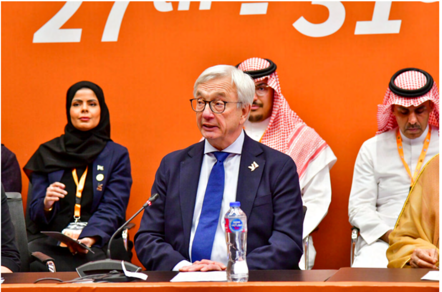
Sr. Karl Eirik Schjøtt-Pedersen, Auditor General de Noruega.

Más información sobre PESA: https://idi.no/our-work/initiative/pesa/