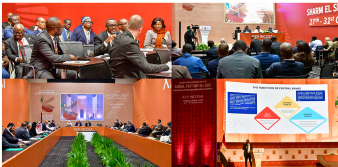
Grupos de debate del Tema 1.

Los congresistas resaltaron la importancia de unos mandatos legales claros. La ambigüedad puede derivar tanto en un intervencionismo excesivo como en restricciones indebidas, y en ambos casos se debilita la rendición de cuentas. Por contra, unas delimitaciones bien definidas fomentan la cooperación constructiva y refuerzan el respeto mutuo entre las instituciones. La fiscalización no debería interferir en la independencia política, pero la independencia tampoco debería convertirse en blindaje contra el control.