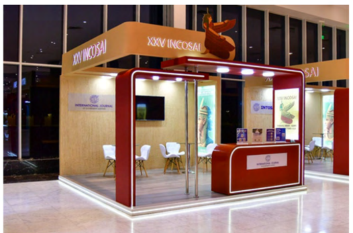
Revista Internacional de Auditoría Gubernamental. Fuente: Revista Internacional de Auditoría Gubernamental