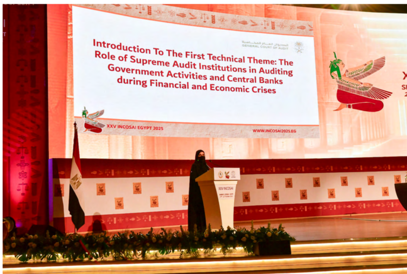
Sra. Yara Alaqeel, del Tribunal General de Cuentas de Arabia Saudí, ponente general del Tema 1.

La auditoría de crisis debería evaluar la coordinación entre los ministerios de finanzas, los bancos centrales y los reguladores — porque las crisis ponen a prueba a los sistemas, no a las instituciones a título individual. La auditoría en tiempo real y los mecanismos de seguimiento estructurados permiten transformar los hallazgos en reformas tangibles.