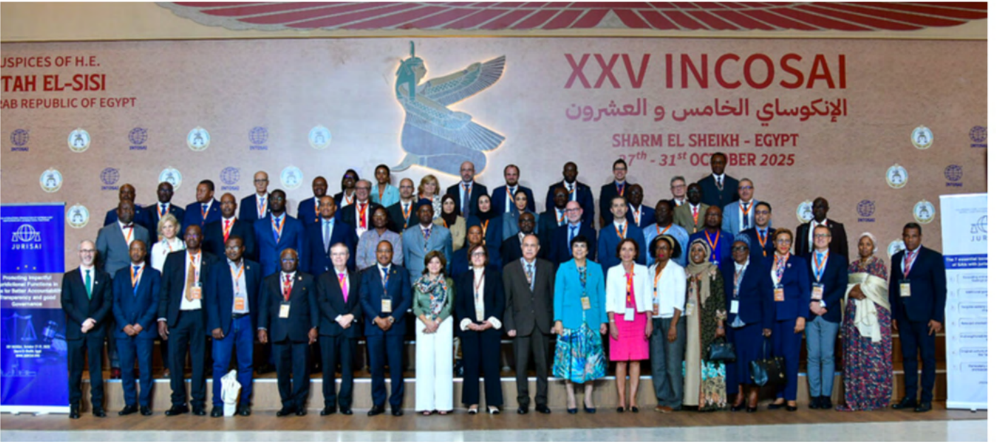
Miembros de JURISAI.