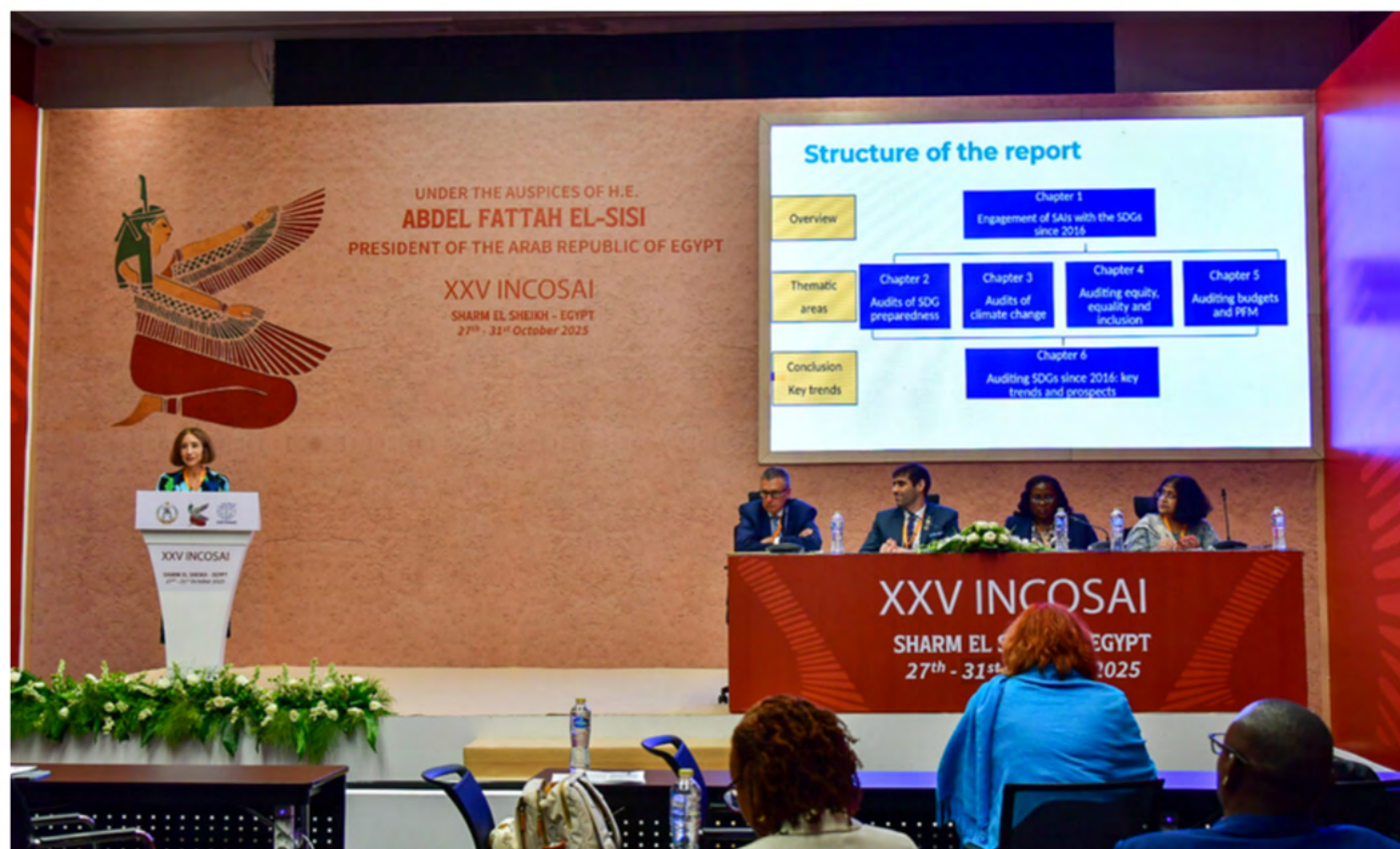
Evento paralelo conjunto de UNDESA e IDI durante el XXV INCOSAI sobre el Informe del Sector Público Mundial 2025.

Las EFS también han identificado las limitaciones institucionales que obstaculizan el progreso de los ODS, permitiendo a los gobiernos ajustar los mecanismos, procesos y políticas institucionales. Ejemplos de distintos ámbitos políticos ilustran cómo las recomendaciones de las auditorías han impulsado la adopción de medidas correctivas y la mejora de la gobernanza. En general, el Informe muestra que las contribuciones de las EFS al seguimiento y la revisión de los ODS se han ampliado considerablemente, aunque siguen existiendo oportunidades significativas para seguir integrando las conclusiones de las auditorías en los mecanismos formales de seguimiento y revisión.