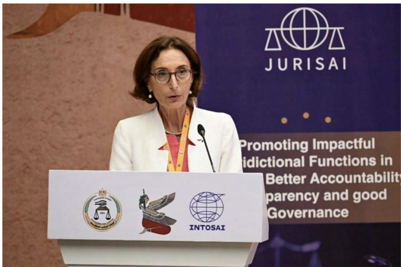
Véronique Hamayon, Fiscal General del Tribunal de Cuentas francés, presidió la Asamblea General Extraordinaria de JURISAI.

Ante unos 70 participantes, cuatro ponentes destacaron el valor añadido de la revisión judicial en entornos de crisis caracterizados por la urgencia, la complejidad de la toma de decisiones públicas y el aumento de los requisitos de rendición de cuentas. Los debates se centraron en particular en: