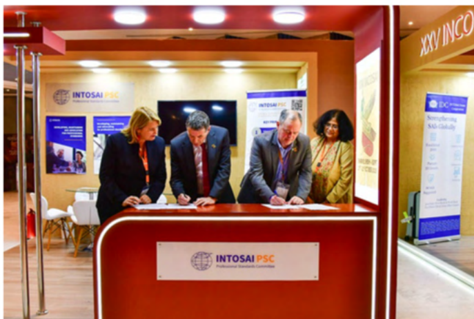
Firma del memorando de entendimiento entre el Comité de Normas Profesionales (PSC) de la INTOSAI y la IDI en el stand del PSC.