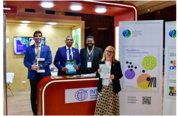
Comité de Intercambio de Conocimientos de la INTOSAI y Grupo de Trabajo de la INTOSAI sobre Auditoría Medioambiental.