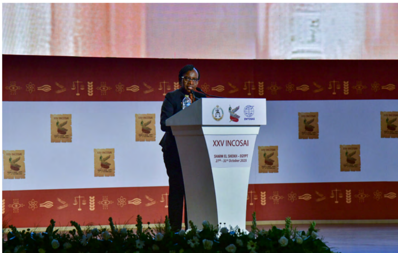
Nancy Gathungu, Auditora General de Kenia.

Pero la Auditora General Gathungu también insistió en un principio crucial: solo hay que invertir en la IA y en los avances tecnológicos que realmente se vayan a utilizar. La adopción debería ser escalonada, contextualizada e inclusiva. Posiblemente, los auditores jóvenes sean los paladines de la innovación, pero son los profesionales experimentados los depositarios de la sabiduría institucional. El éxito radica en conciliar a unos y otros. La IA, recordó al Congreso, existe en un continuum. Las instituciones pueden empezar poco a poco, aprender y luego escalar.