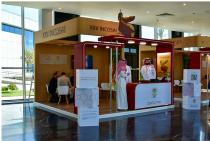
El Tribunal General de Cuentas de Arabia Saudí.