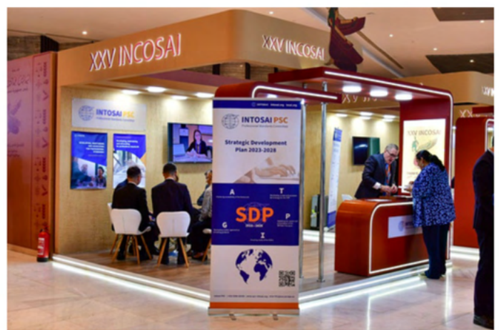
Comité de Normas Profesionales de la INTOSAI.