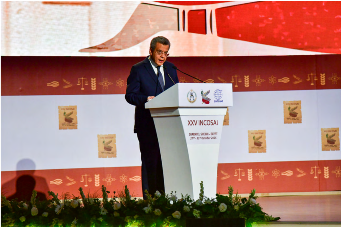
El Presidente de la Autoridad Estatal de Rendición de Cuentas y Presidente de INTOSAI, Mohamed El-Faisal Youssef, presentó la Declaración de Sharm El-Sheikh.

La Declaración de Sharm El-Sheikh guiará a la INTOSAI y a sus EFS miembros en la configuración de sus acciones y prioridades en los próximos años, teniendo en cuenta las profundas transformaciones globales, los rápidos avances tecnológicos y los complejos entornos financieros y económicos en los que operan las EFS.