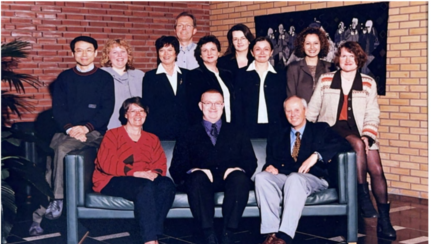
Foto del personal de la Iniciativa de Desarrollo de la INTOSAI en Oslo, 2001.