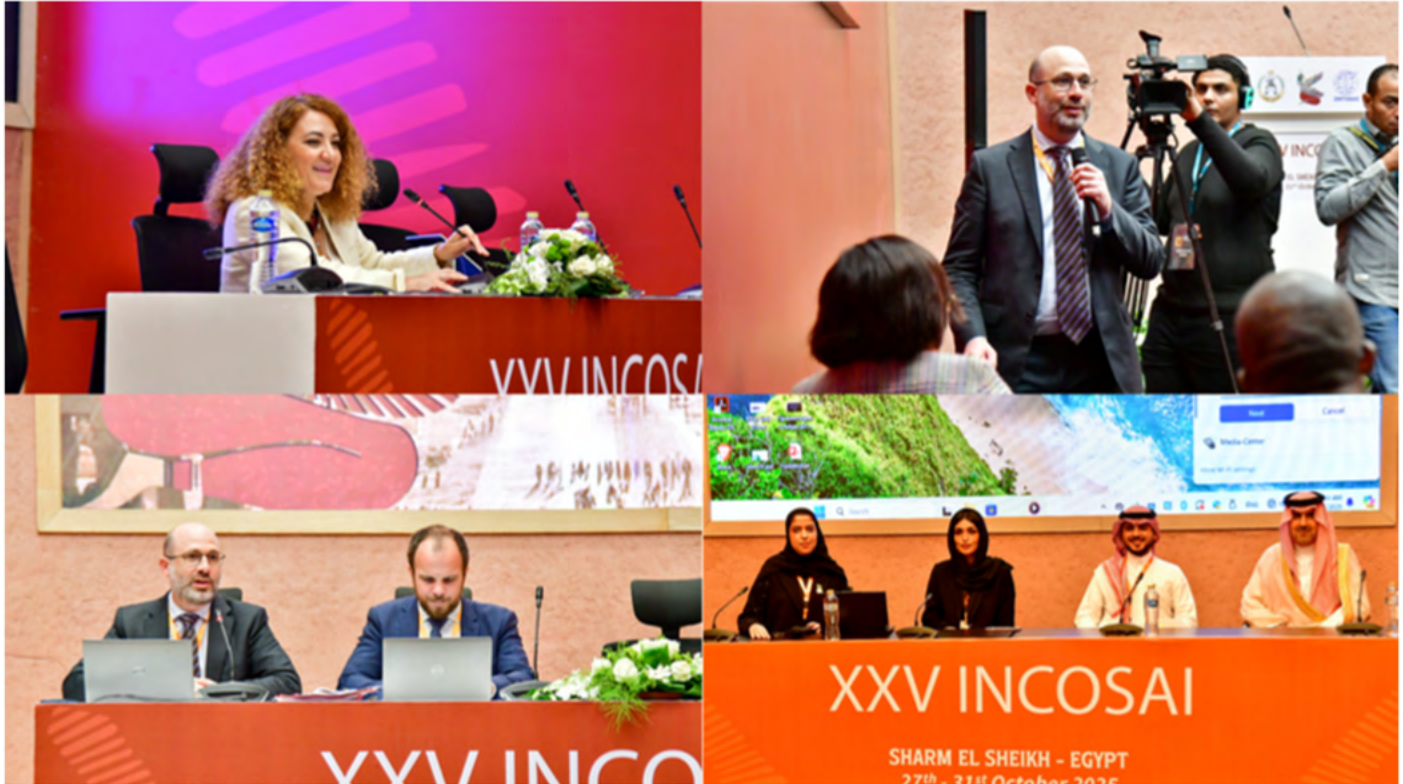
Moderadores de los debates del Tema 2.

Los delegados del INCOSAI reconocieron que el camino hacia la adopción efectiva de la IA no estaba exento de importantes desafíos. Entre las preocupaciones más apremiantes destacaba el problema de la «caja negra» de la IA, es decir, esa opacidad o falta de transparencia en el funcionamiento interno de un algoritmo o modelo de IA. Por otra parte, muchas organizaciones se enfrentan a sistemas informáticos heredados e incompatibles con las soluciones modernas de IA, al tiempo que los datos críticos a menudo permanecen bloqueados en silos. Las consideraciones relativas a la privacidad y la conformidad legal añaden nuevos niveles de complejidad, al margen de los notables costes iniciales que exige la implantación de tecnologías avanzadas. Y la resistencia institucional y las carencias en materia de habilidades y capacidades pueden obstaculizar aún más el progreso.