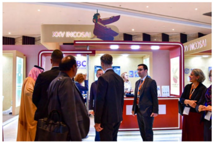
Comité de Desarrollo de Capacidades de la INTOSAI.