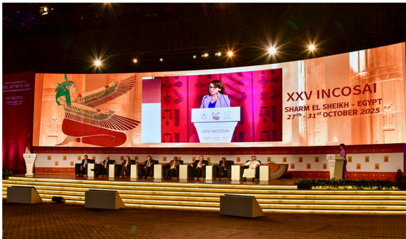
Mesa redonda sobre el Tema II de INCOSAI.