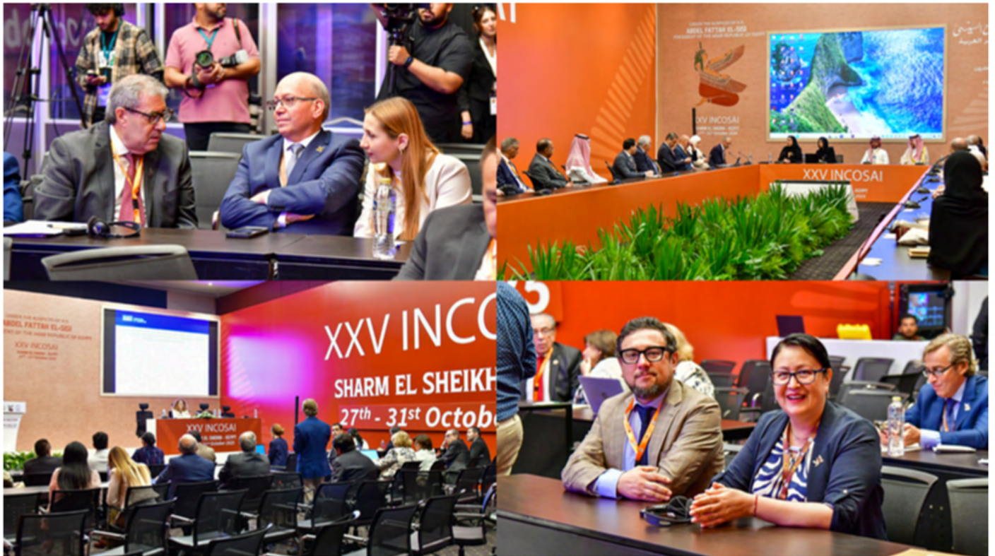
Sesiones de debate del Tema 2.