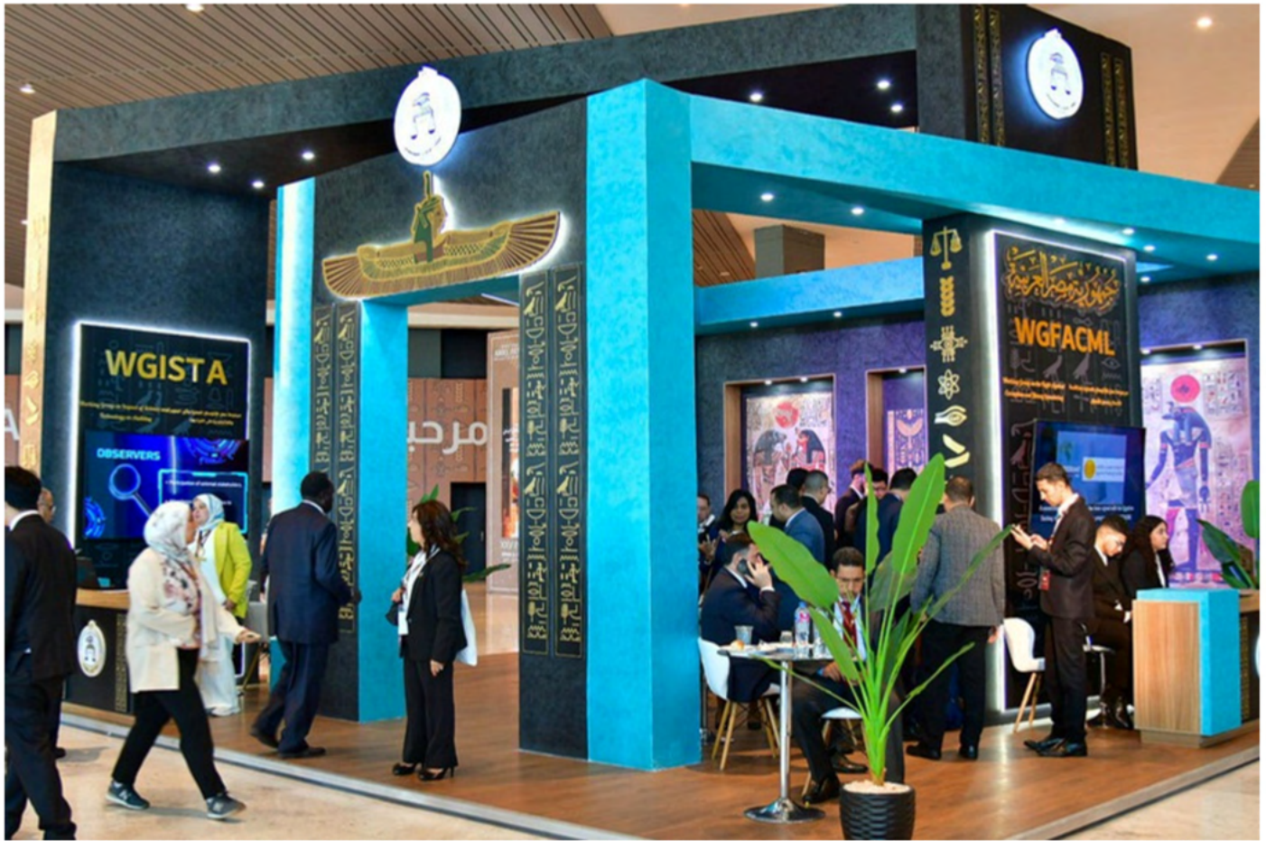
El presidente de la INTOSAI, la EFS de Egipto y el Grupo de Trabajo de la INTOSAI sobre el Impacto de la Ciencia y la Tecnología en la Auditoría (WGISTA), así como el Grupo de Trabajo de la INTOSAI sobre la Lucha contra la Corrupción y el Blanqueo de Capitales (WGFACML).