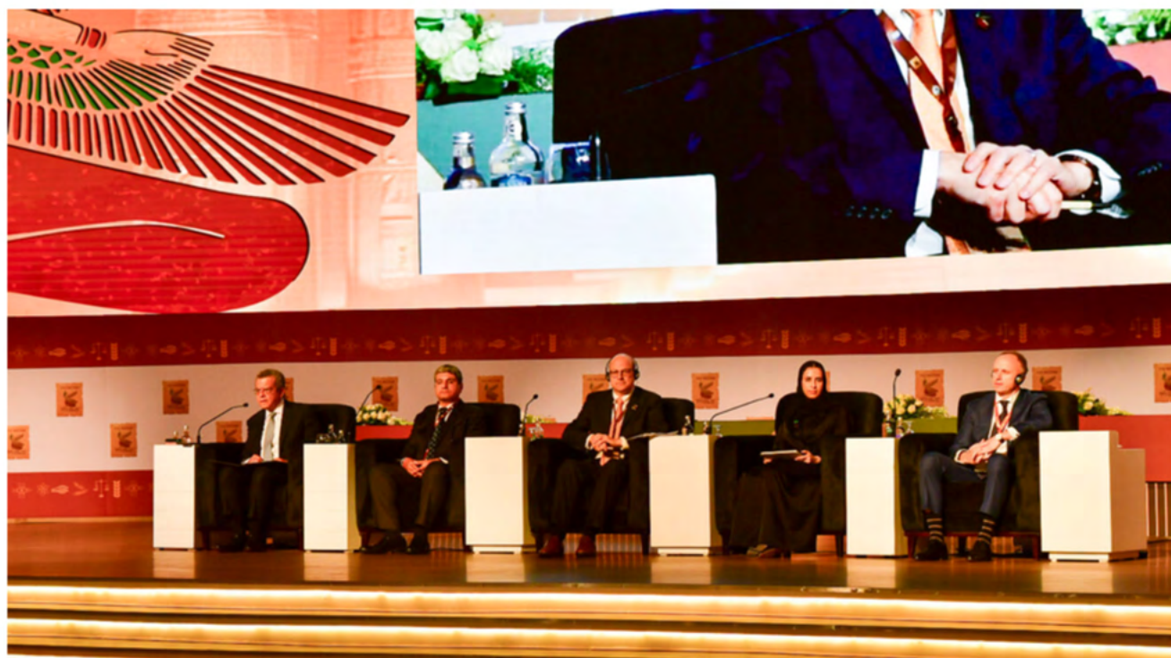
Ponentes del Tema 1.