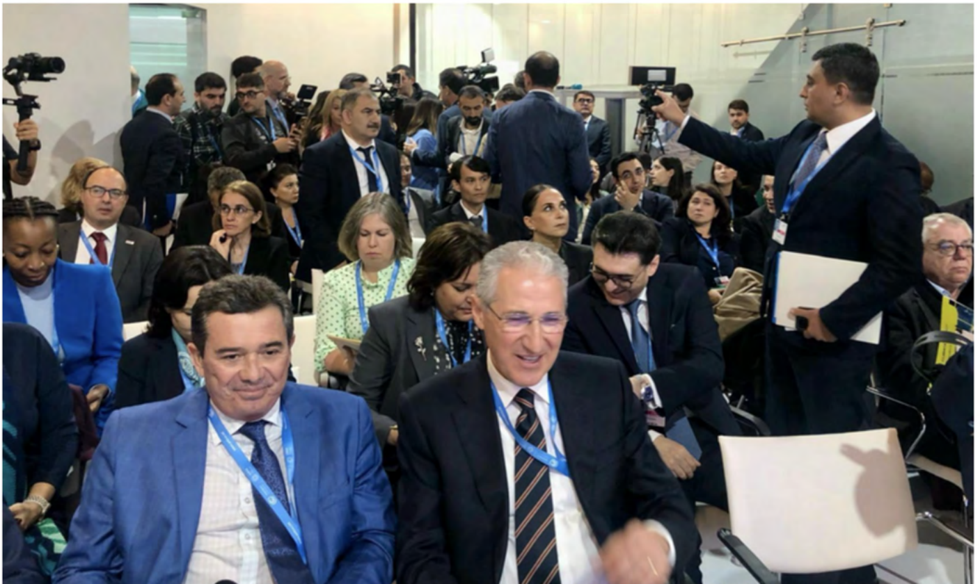
Público asistente al acto paralelo de las EFS en la COP29.

Hay que llevar los mensajes de las EFS a los lugares donde se configuran las políticas. Los actos más visibles para el GTAMA han sido las conferencias sobre el clima, en las que hemos participado tres veces con nuestro propio acto paralelo. Garantizar el acceso y organizar este tipo de actos requiere la colaboración con la EFS del país anfitrión (la EFS de los EAU en la COP28, la EFS de Azerbaiyán en la COP29 y la EFS de Brasil en la COP30) y las delegaciones nacionales, así como nervios de acero para gestionar los preparativos de última hora y las incertidumbres. Lo más destacado fue la COP29 en Bakú y la presencia del Presidente de la COP en nuestro evento.