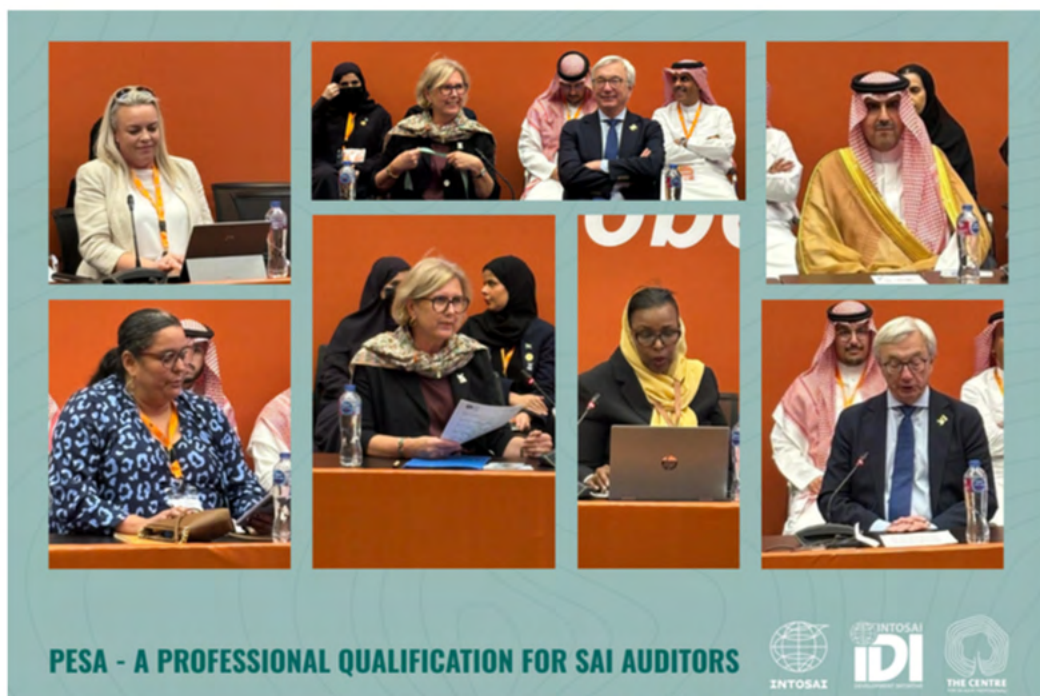
Fuente: Iniciativa de Desarrollo de la INTOSAI