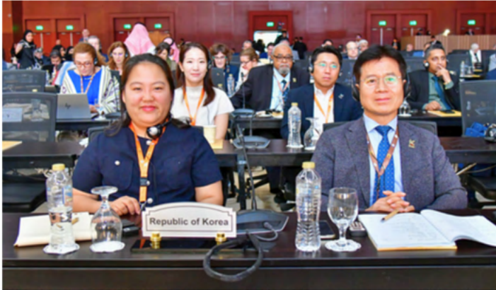
La Delegación de la Junta de Auditoría e Inspección de Corea.

El Pleno General de INTOSAI eligió a los Auditores Externos de INTOSAI para mandatos de tres años. La EFS de Ecuador, de la región OLACEFS, renovó su mandato, y la EFS de la República de Corea, en representación de ASOSAI, fue seleccionada como nuevo Auditor de INTOSAI, en sustitución del cargo que ocupaba la EFS de Jamaica. La EFS de Ecuador y la EFS de Corea supervisarán la auditoría de INTOSAI para los estados financieros de 2025-2027. La INTOSAI recibió este año un dictamen de auditoría limpio por parte de sus auditores.