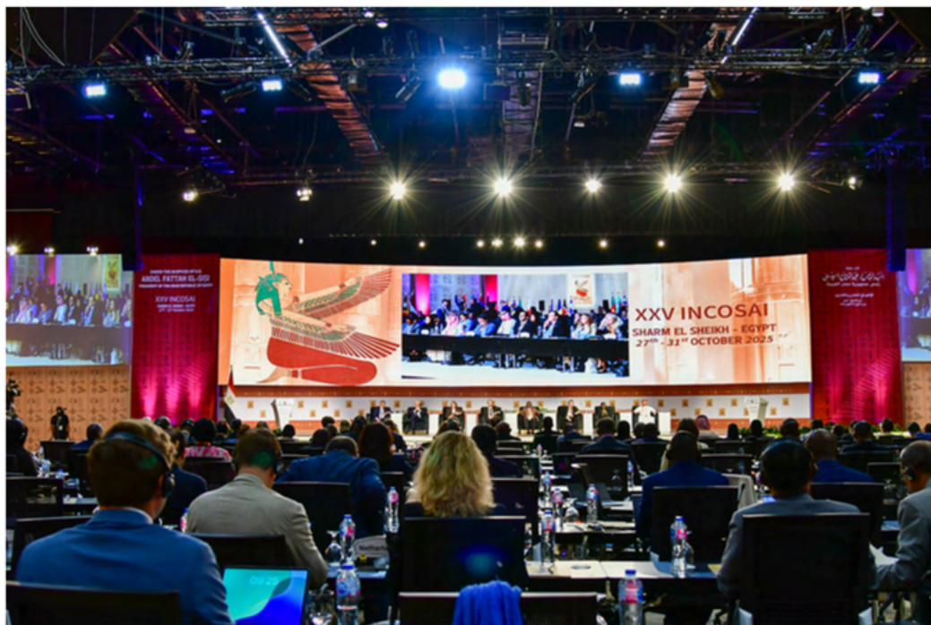
Panelistas del Tema II del INCOSAI.