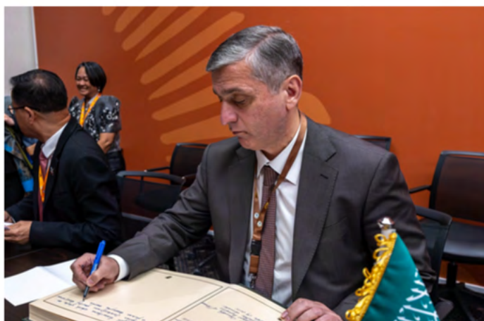
Vugar Gulmammadov, Presidente de la Cámara de Cuentas de la República de Azerbaiyán, firma el libro de reflexiones del FISP saudí.