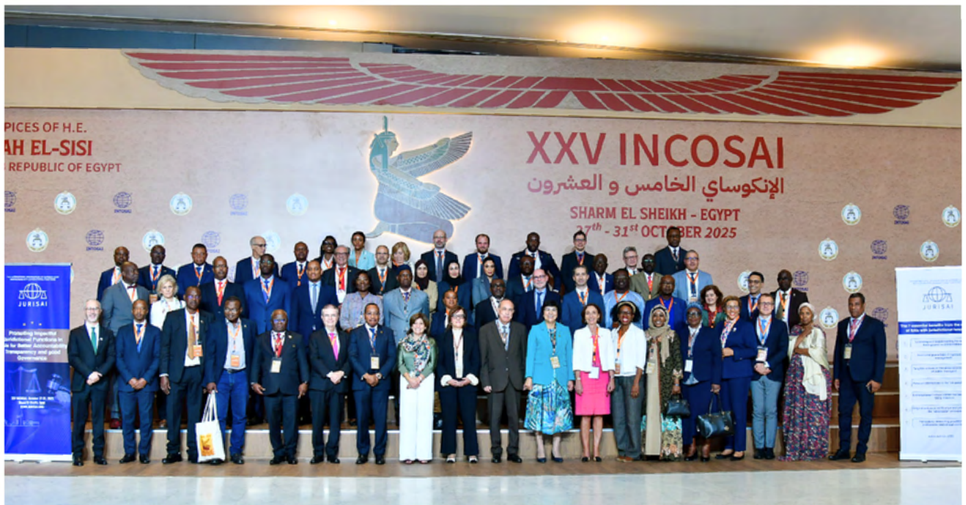
Miembros de JURISAI.

La presidencia de JURISAI la ostenta actualmente el Tribunal de Cuentas de la República Francesa, y la Secretaría General es el Tribunal de Cuentas de Marruecos.