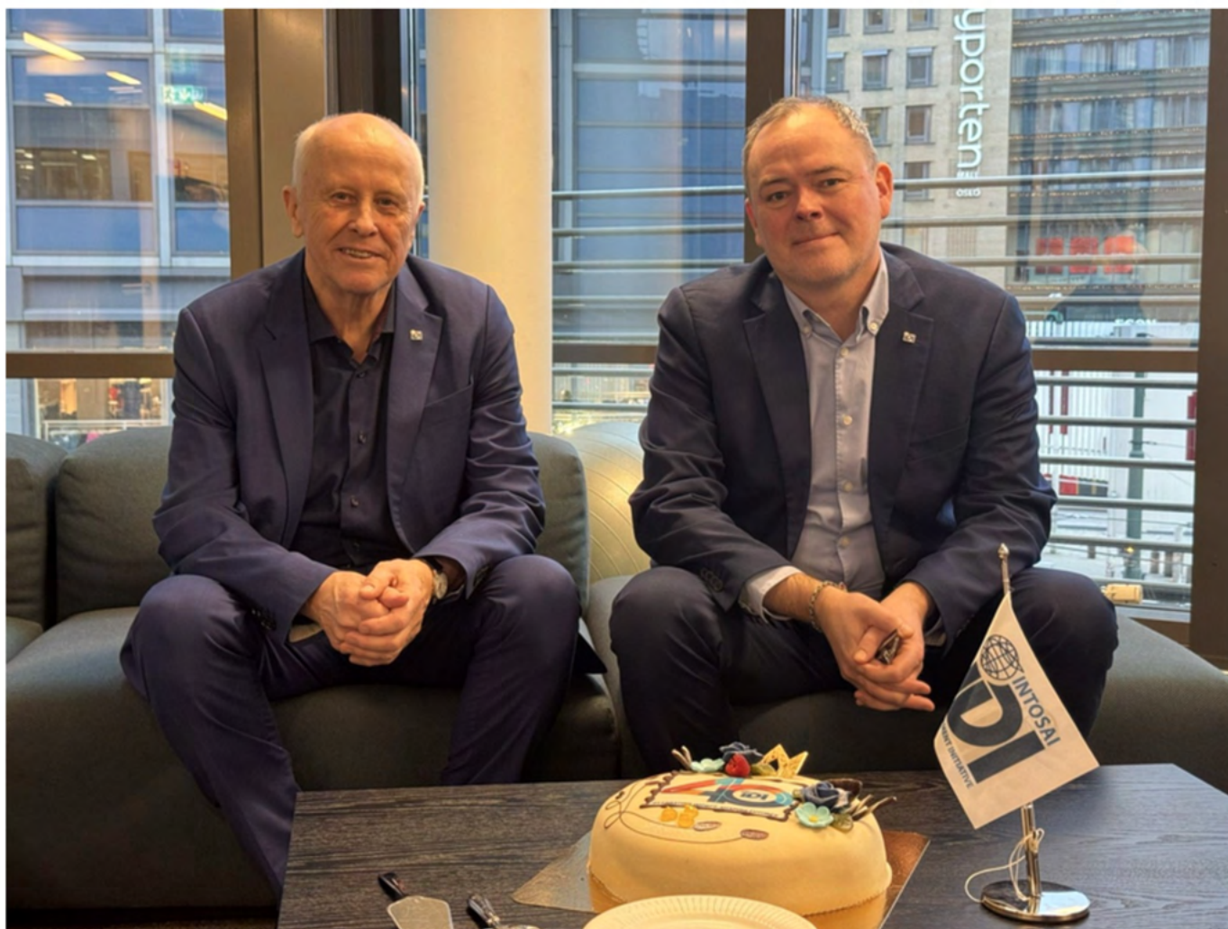
El exdirector general de la Iniciativa de Desarrollo de la INTOSAI, Magnus Borge (izquierda), y Einar Gørrissen, director general de la Iniciativa de Desarrollo de la INTOSAI.

Fortalecer a las EFS no es un mero ejercicio técnico, en el que se capacita, se transfieren conocimientos y luego se esperan resultados. Lo cierto es que los últimos cuarenta años nos han enseñado que el fortalecimiento de las EFS requiere algo mucho más complejo: un compromiso a largo plazo, conocimiento institucional, confianza mutua y una red que crea en la misión.